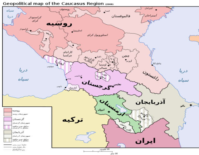
شکل - ۱: قفقاز و موقعیت ژئوپلیتیک جمهوری آذربایجان در آن

از ۱۹۲۲ تا ۱۹۳۶، این کشور بخشی از جمهوری سوسیالیستی ماورای قفقاز شوروی بود و مانند گرجستان و ارمنستان، دچار گسترش شهرنشینی شد و با پیشرفت‌های گسترده اقتصادی، صنعتی شد. در این جمهوری آموزش به زبان آذربایجانی بود و مقامات مهم اجرایی آذربایجانی بودند. در سال‌های ۱۹۸۸ و ۱۹۹۰، خشونت ضد ارمنیان به ترتیب در سومقائیت، و باکو بروز کرد و نتیجتاً در ۱۹۹۰ حکومت مسکو دست به عملیات نظامی علیه جمهوری آذربایجان زد. ( http://www.azerbaijan.com )